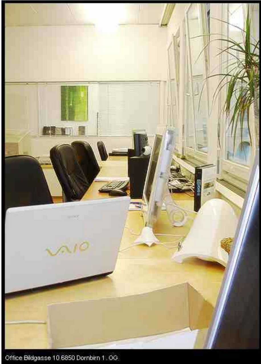
Office Bildgasse 10 6850 Dornbirn 1. OG.