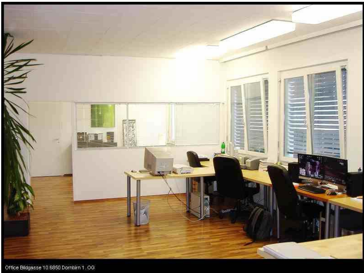
Office Bildgasse 10 6850 Dornbirn 1. OG