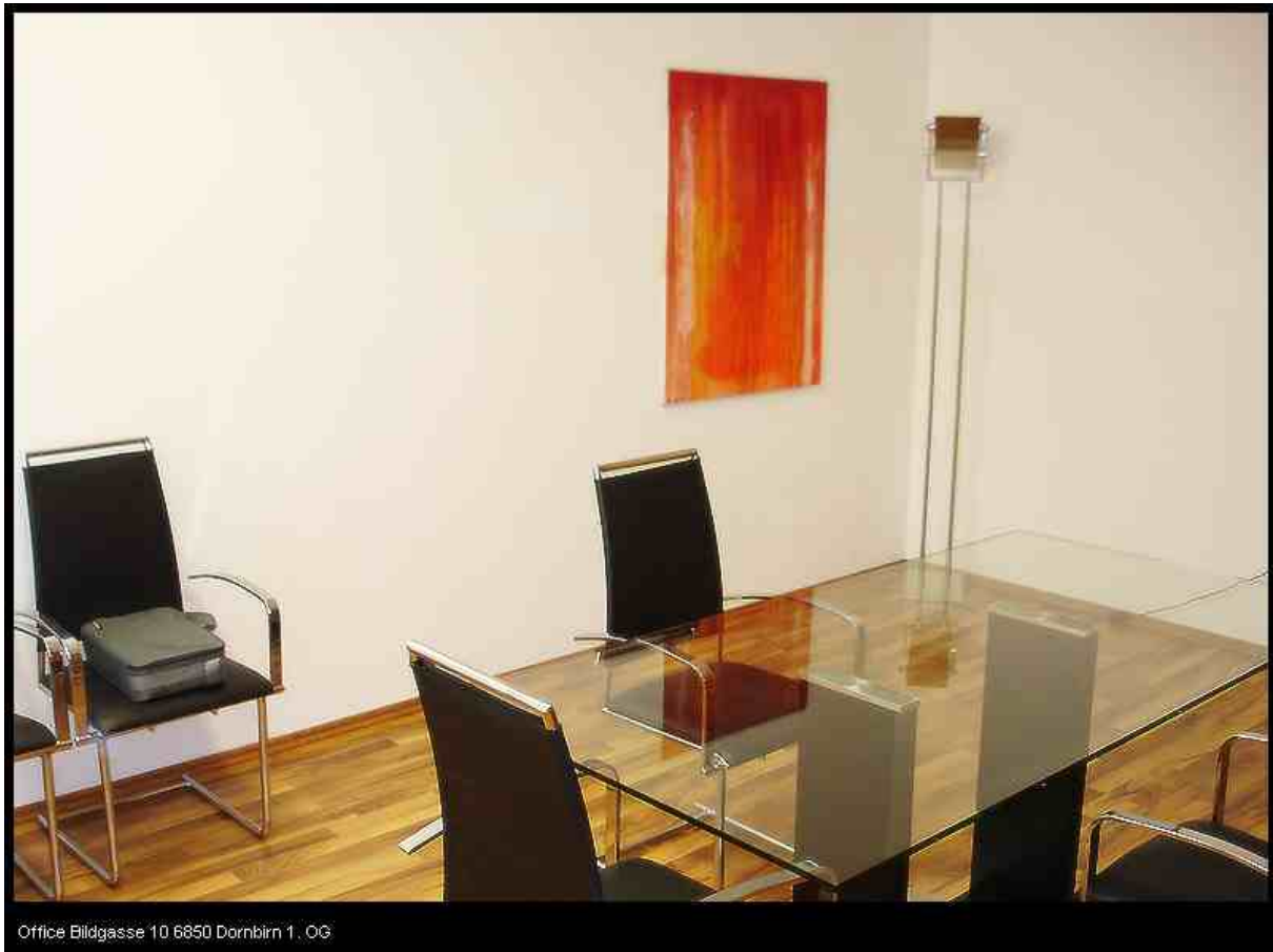
Office Bildgasse 10 6850 Dornbirn 1 . OG